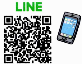
LINE公式アカウント 「上町自主防災会 ワーキンググループ」